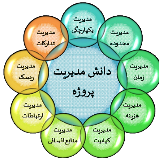
شکل 1: مدیریت دانش پروژه و زیر حوزه‌های آن