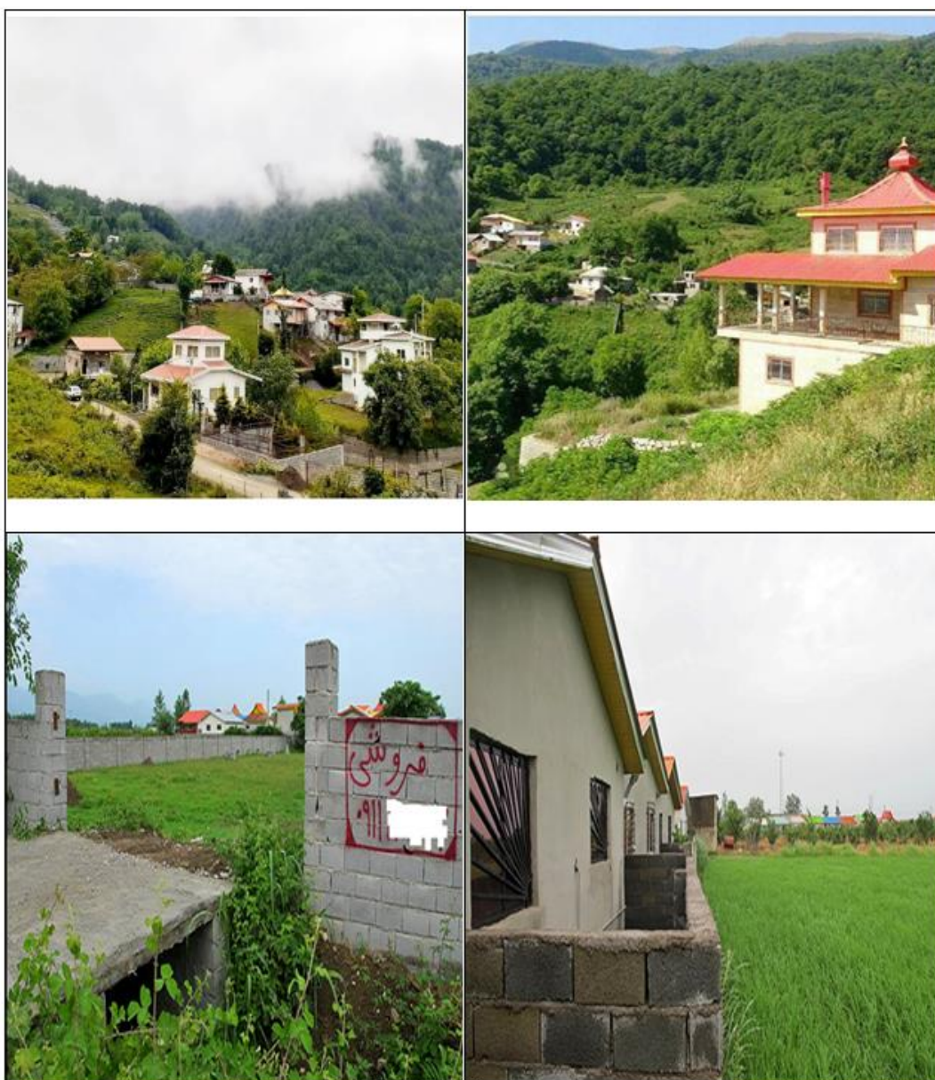
شکل شماره ۲. تصاویری از پدیده خزش و خوردگی چشم‌انداز در ناحیه چمستان

است که این ویژگی‌ها اغلب در جوانان وجود دارد؛ این در حالی است که امروزه، جوانان روستایی به دلایلی چون به‌صرفه نبودن مشاغل کشاورزی و عدم توجه کافی به کشاورزی و کشاورزان و مسائل و مشکلات آنان و جایگاه اجتماعی پایین‌تر این فعالیت در مقایسه با فعالیت‌های مرتبط به خدمات (فعالیت‌های گردشگری)، گرایش کمی به فعالیت کشاورزی دارند. تغییر سبک زندگی روستاییان از سادگی به تجمل‌گرایی، دسترسی روستاها به امکاناتی چون برق، آب و گاز، وجود نظام زراعی خرده‌مالکی و قطعه‌قطعه بودن اراضی از جمله متغیرهای اجتماعی مهم دیگری است که وقوع پدیده خزش در روستاهای مورد مطالعه را موجب شده‌اند.