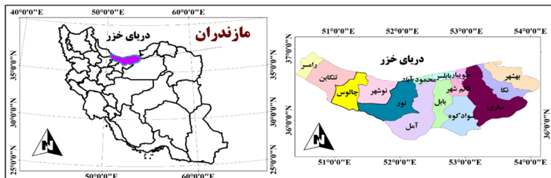
شکل شماره ۱. موقعیت منطقه مورد مطالعه، منبع: (نگارندگان، ۱۳۹۹)