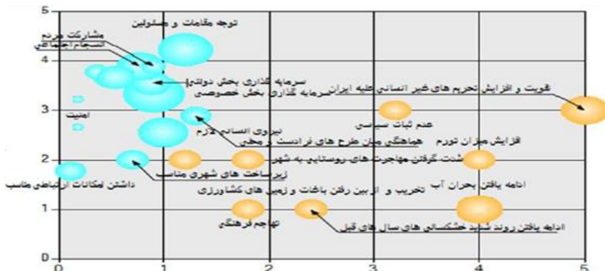
شکل شماره ۴. نقشه راهبردی مدیریت شهری در سکونتگاه‌های غیررسمی

بر اساس این نقشه راهبردی در بین عوامل ضروری در سکونتگاه‌های غیررسمی شهر پاکدشت، برنامه‌ریزی راهبردی و توجه مقامات و مسئولان مدیریتی در رتبه اول قرارداد، در واقع، بر اساس توزیع بودجه سالانه این شهر، مشارکت مردم و انسجام اجتماعی، عاملی ضروری است چراکه، امتیاز زیادی را به خود تخصیص داده است. این موضوع در سال‌های اخیر به علت برخی مشکلات از قبیل استفاده از مدیران غیربومی و عدم پاسخگویی مسئولان و شهروندان نسبت به امور شهر بوده است. یکی از مقدمات توسعه در شهر، داشتن برنامه‌ریزی منسجم است و شهر پاکدشت نیز از این قانون مستثنی نیست. از دیگر عوامل که باید توجه خاصی بدان شود، استفاده از همه پتانسیل‌های مدیریت شهری است. توانایی‌های مدیریتی به‌درستی بهره‌برداری نشده است. گام بعد که با توجه به‌اندازه حباب آن از ضرورت زیادی برخوردار است. سرمایه‌گذاری‌های بخش دولتی و خصوصی در سکونتگاه‌های غیررسمی است. در این بین، عوامل کلان محیطی که باید به آن توجه ویژه‌ای شود. به خاطر وجود تحریم‌های سیاسی و غیرانسانی سبب کم شدن معیشت افراد و افزایش میزان تورم شده و همین عامل باعث مهاجرت روستائیان به شهرها، تفکیک غیرمجاز زمین‌های کشاورزی توسط سودجویان و ساخت‌وسازهای غیرمجاز است. درنهایت برای توانمندسازی و ساماندهی سکونتگاه‌های غیررسمی در پاکدشت به ارائه راهکارهای مدیریتی پرداخته شده است.