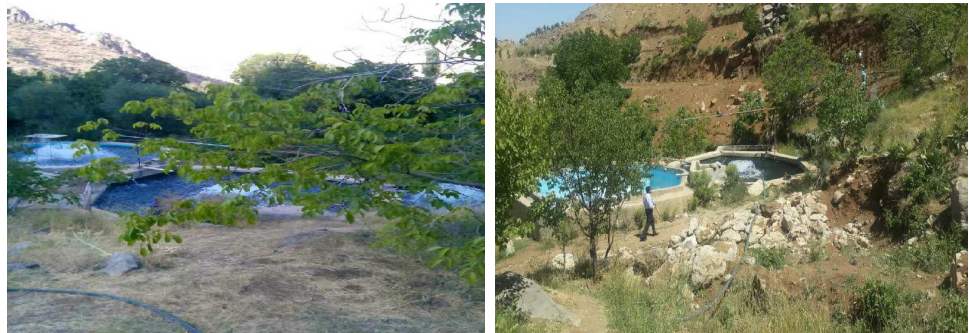
مجتمع پرورش ماهی روستای تخت زنگی

روستاها بوده است. این معضل در روستاهای مورد پژوهش نیز به‌نحوی بارز مشهود است. برخی سرمایه‌گذاری‌های شهری به این معضل دامن زده، در روند آلودگی منابع آب و خاک روستایی نقش بارزی داشته‌اند. سرمایه‌گذاری‌های شهری، به‌ویژه در زمینه پرورش آبزیان، با ایجاد تأسیسات در کنار و یا حتی در مسیر رودخانه‌ها، ضمن بهره‌گیری از آب سالم رودخانه‌های محلی، زمینه‌ساز آلودگی جدی منابع آب روستاها شده‌اند. ورود فاضلاب این گونه تأسیسات به آب رودخانه‌ها، در کنار فاضلاب‌های خانگی، نه تنها موجب آلودگی، بلکه به خطرانداختن بهداشت و محیط زیست روستاییان شده است، به‌خصوص آن‌که اغلب رودخانه‌های محلی از میان بافت روستاها جریان دارند. از روستاهای محدوده که بیشتر در معرض این روندهای آلوده‌ساز هستند، می‌توان از روستاهای پالنگان، لون سادات، دژن، ماویان، کوره دره علیا، کلاته و لون کهنه نام برد. این روستاها به‌سبب قرارگیری در حاشیه و یا دو سوی رودخانه گاورود، بیشتر در معرض آلودگی‌های حاصل از ورود فاضلاب‌ها و بعضاً زباله‌های خانگی و نیز فاضلاب تأسیسات پرورش ماهی و مانند آن هستند.