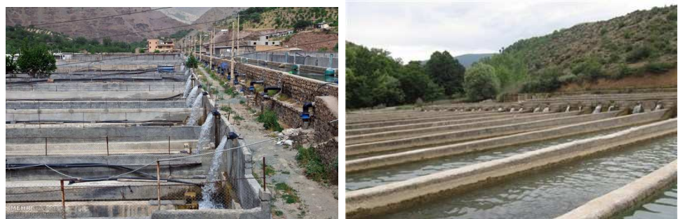
مجتمع پرورش ماهی روستای پالنگان