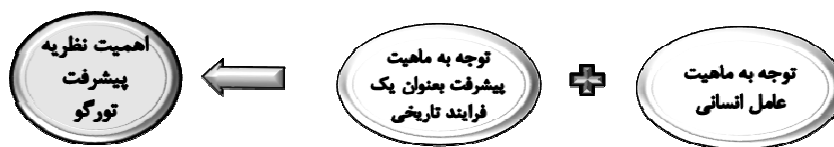
شکل ۱: تورگو و اهمیت نظریه پیشرفت

تورگو معتقد بود در همه زمان‌ها و مکان‌ها از مصر باستان تا عصر رنسانس، عوامل یکسانی تأثیرات خود را بر روی تکامل و تحول مدام جامعه انسانی گذاشته‌اند. این عوامل عبارتند از اغراض نفسانی، خرد، اقلیم و جغرافیا. او سعی کرد شواهدی از تاریخ بشر که الگوهای مهمی در مورد رشد و پیشرفت ملت‌ها در بردارد را نشان دهد.