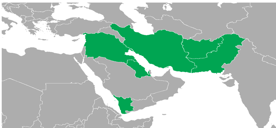
شکل ۲. کشورهای حوزه‌ی محور مقاومت

محور مقاومت: محور مقاومت را می‌توان یک همگرایی ژئوپلیتیکی در نظر گرفت که از نظر فلسفه و معرفت‌شناسی یا رخداد انقلاب اسلامی در ایران آغاز شد و به یک رویه و واقعیت سیاسی و مکانی در غرب و جنوب غرب آسیا تبدیل گردید (Dyer, 2017: 4). گزاره‌های انقلاب اسلامی با محوریت اسلام سیاسی به آسیای میانه و قفقاز هم سرایت کرد (Bishku, 2015: 86). بر پایه‌ی ماهیت متفاوت انقلاب اسلامی ایران که به نوعی گفتمان جدیدی را در مقابل کمونیسم و کاپیتالیسم ارائه می‌داد، لزوم بیداری و هویت‌یابی مجدد مسلمانان بر اساس فرهنگ و تمدن اسلامی مورد تأکید قرار گرفت (متقی و قره‌بیگی، ۱۳۹۳: ۶۶). این فرایند با افزایش تحولات در جهان عرب که از سال ۲۰۱۱ به این سو آغاز شد، روندی تازه به خود گرفت و کشورها و گروه‌هایی که با آرمان‌های انقلاب اسلامی در ایران، همخوان و همگرا بودند، محور مشترکی را برای مقابله با قلمروخواهی کشورهایمانند آمریکا، اسرائیل و عربستان سعودی تشکیل دادند (Yagnar, 2016: 298). محور مقاومت، مجموعه‌ای از واحدهای سیاسی-فضایی و گروه‌های نیابتی است (صادقی و همکاران، ۱۴۰۰: ۹۲). کشورهایی چون ایران، سوریه، فلسطین و عراق به عنوان کشورهای حوزه‌ی مقاومت و حزب‌الله لبنان، حشدالشعبی عراق، فاطمیون افغانستان، زینبیون پاکستان، حسینین آذربایجان و انصارالله یمن به‌عنوان کنشگران اصلی محور مقاومت به‌شمار می‌روند (شکل ۲).