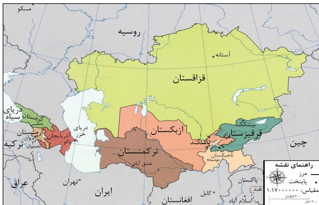
شکل ۱. نقشه آسیای مرکزی و قفقاز