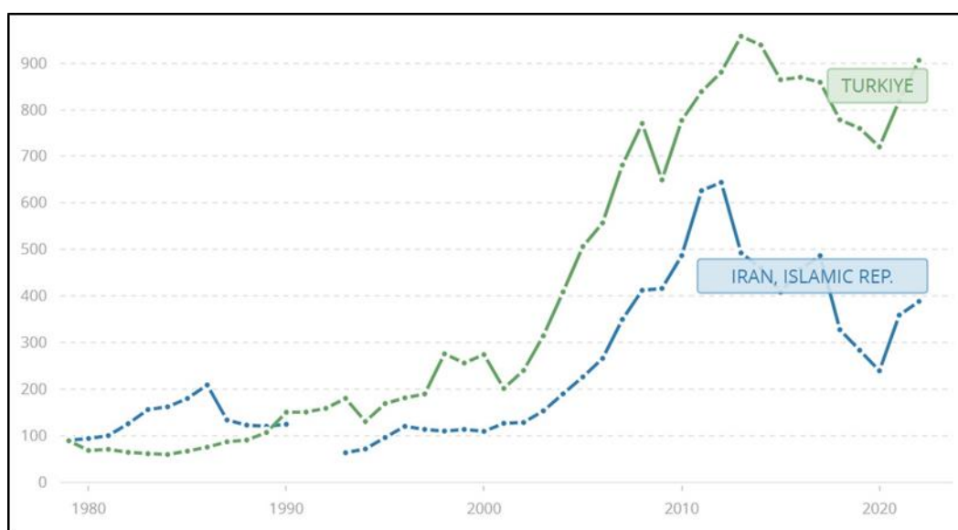
شکل ۲. مقایسه تولید ناخالص داخلی دو کشور بین سال‌های ۱۹۷۹ الی ۲۰۲۲

رقابت بر سر منافع اقتصادی یکی از مولفه‌های تزامم منافع ژئوپلیتیکی است. این در حالی است که بر اساس آخرین آمار، تولید ناخالص داخلی در ترکیه برابر با ۹۰۵,۹۹ میلیارد دلار و ایران ۳۸۸,۵۴ میلیارد دلار بوده است (Worldbank, 2023). با این حال ترکیه تلاش بیشتری برای کسب منافع اقتصادی به خصوص از جانب آسیای مرکزی و قفقاز دارد. در نمودار زیر مقایسه تولید ناخالص داخلی ایران و ترکیه از سال ۱۹۷۹ میلادی الی ۲۰۲۲ به تفکیک بررسی شده است.