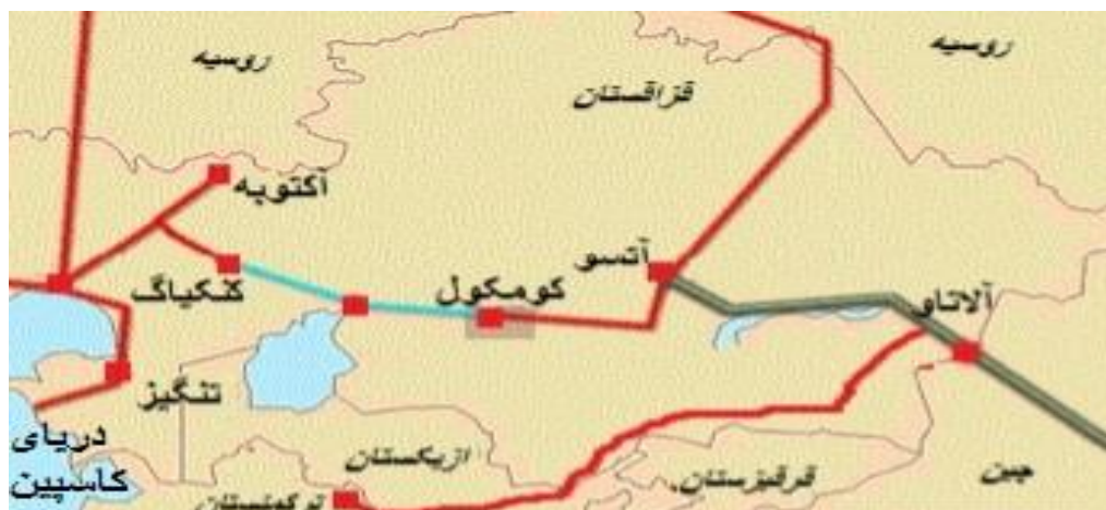
شکل شماره ۶. مسیر شرقی

اگر مسیرهای غرب و شمالی مورد نظر ایالات متحده آمریکا و روسیه هستند، مسیر شرقی نیز مورد نظر قدرت نوظهور چین است. چین قصد دارد با ایجاد مسیر شرقی انتقال نفت و گاز دریای کاسپین با نفوذ و سلطه تاریخی روسیه بر انرژی این حوضه به مقابله برخیزد. چین از این مسیر نفت و گاز ترکمنستان و قزاقستان را به کشور خود منتقل می کند. یک خط لوله اضافی از ترکمنستان به چین (با عبور از قزاقستان از طریق قرقیزستان) در سال ۲۰۱۳ هم در دست اجراست (Lelyveld, 2019: 4). خط لوله قزاقستان-سین کیانگ به طول ۳۰۰۰ کیلومتر مسیر شرقی انتقال انرژی به کشور چین و بازارهای شرق آسیاست. این مسیر نیز به دلیل طولانی و پرهزینه بودن مسیری غیر اقتصادی به حساب می آید (شکل ۶).