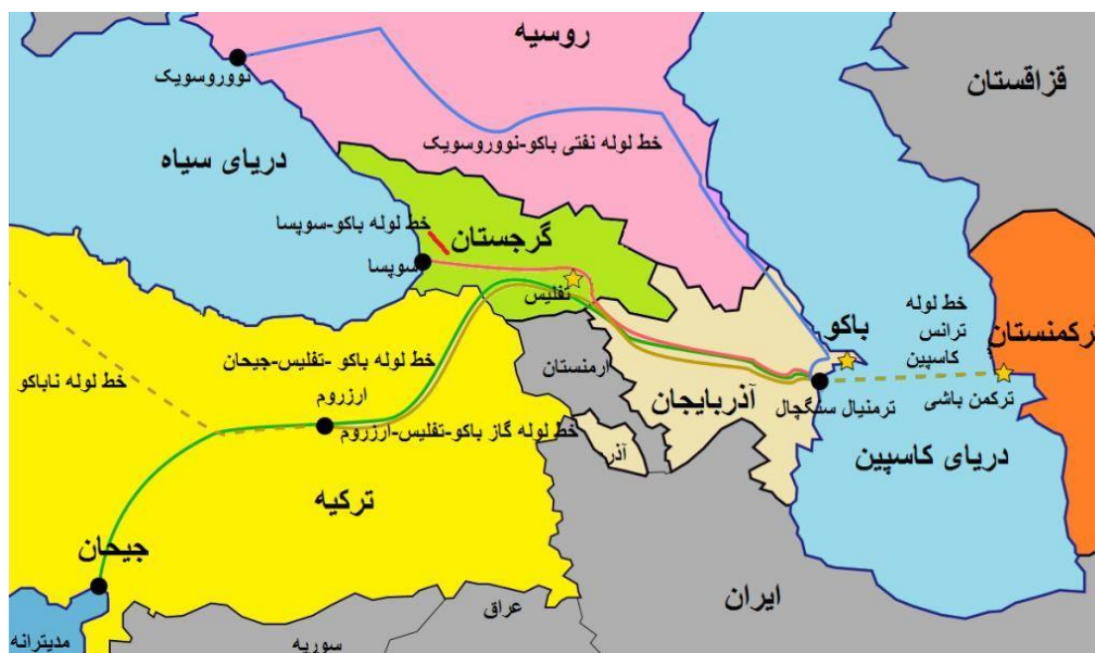
شکل شماره ۴. مسیرهای ترانزیت انرژی نفت و گاز حوضه کاسپین به مراکز مصرف

پروژه دیگری که در این مسیر برنامه ریزی شده است، توسعه پروژه جریان جنوب است، این خط لوله رقیب خط لوله نابکو بود که گاز روسیه را از طریق زیربستر دریای سیاه از یک شاخه به بلغارستان-یونان و ایتالیا و از طریق شاخه ای دیگر از طریق بلغارستان-کرواسی-مجارستان و اتریش می رساند. حدود ۹۰۰ کیلومتر این خط لوله در زیر بستر دریای سیاه احداث خواهد شد. ظرفیت نهایی این خط لوله ۶۳ میلیارد متر مکعب در سال می باشد. ضمن اینکه روسیه درصدد ساخت خطوط لوله جایگزین خطوط لوله رقیبی چون نوباکو و ترانس کاسپین است (زمردی انباجی و حاجی یوسفی، ۱۴۰۰: ۱۲۹).