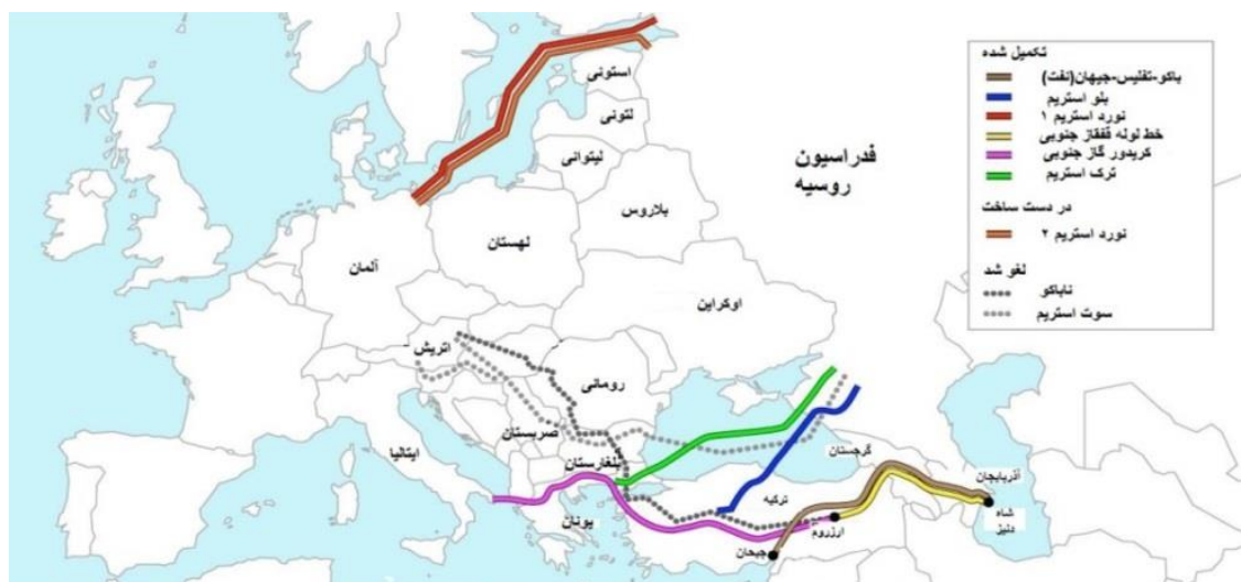
شکل شماره ۵. خطوط لوله نورد استریم-بلواستریم-ترک استریم-سوت استریم