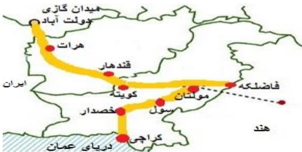
شکل شماره ۷. مسیر جنوب شرقی

این مسیر از جمهوری ترکمنستان آغاز شده و پس از عبور از افغانستان به بنادر پاکستان می رسد. این مسیر نیز به دلیل اختلافات داخلی در افغانستان و نبود زیر ساخت های مناسب و عدم دسترسی افغانستان به آب های آزاد و عبور خط لوله از پاکستان نمی تواند مسیری امن برای ترانزیت نفت و گاز حوضه کاسپین باشد. یکی از این مسیرها خط انتقال گاز ترکمنستان از طریق افغانستان به پاکستان و از پاکستان به هند موسوم به خط لوله تاپی (TAPI) است. خط لوله پیشنهادی ترکمنستان-افغانستان-پاکستان طرح ۱۷۰۰ کیلومتری است که سالانه تا ۳۰ میلیارد متر مکعب گاز طبیعی مصرف کنندگان در پاکستان و احتمالاً هند را تامین می کند. اما نبود امنیت انرژی یکی از دلایل اصلی اجرایی نشدن این پروژه بود، همچنین موانعی چون اختلافات مرزی و ارضی، تروریسم و خشونت گرای و نفوذ قدرتهای منطقه ای نیز در پیشبرد آن موثر هستند (وریج کاظمی، ۱۳۹۹: ۴۰۲) (شکل ۷).