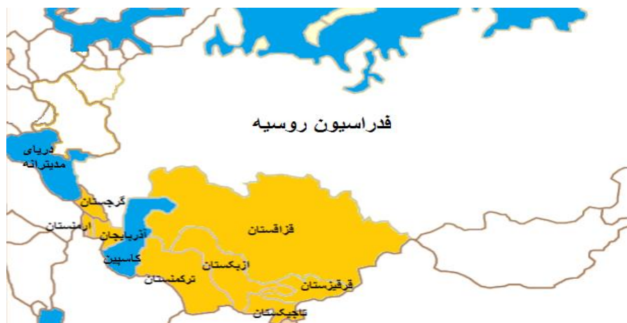
شکل شماره ۱. کشورهای مورد پژوهش

به غیر از سه کشور حوزه بالتیک، روسیه هنوز هم به کشورهای جدا شده از شوروی سابق به عنوان منطقه خاص خود می‌نگرد. روسیه بعد از فروپاشی اتحاد جماهیر شوروی همواره در تلاش بوده تا استراتژی نفوذ خود در این منطقه مهم به عنوان حیات خلوت را گسترش دهد. از این منظر در پژوهش حاضر به بررسی کشورهای خارج نزدیک در دو منطقه قفقاز و آسیای مرکزی از دیدگاه استراتژی ژئواکونومی انرژی نفت و گاز و مسیرهای ترانزیتی آن پرداخته می‌شود.