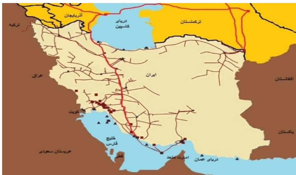
شکل شماره ۳. مسیر جنوبی

تحويل می دهد و به این ترتیب مشکل رسیدن نفت آسیای مرکزی به بازارهای جهانی حل می شود (شکل ۳) ( https://en.trend.az ).