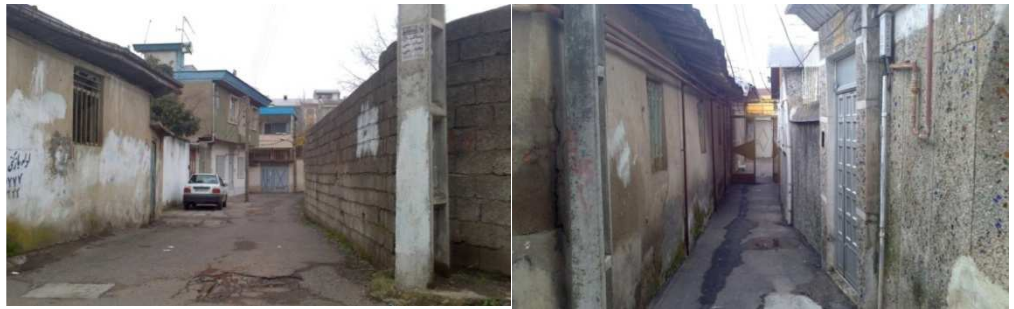
شکل ۳. نمایی از بافت قدیم استادسرای رشت