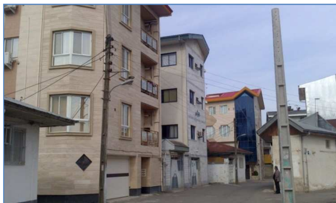
شکل ۵. نمایی از بافت جدید استادسرای رشت