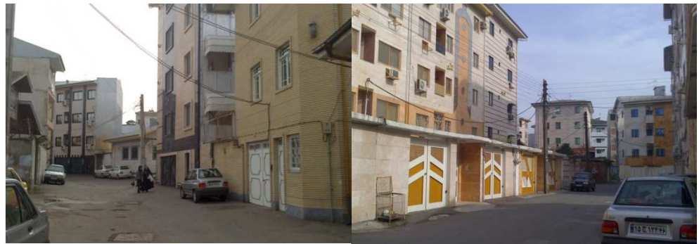
شکل ۴. کوچه‌های بافت جنوبی و جنوب شرقی استادسرای رشت