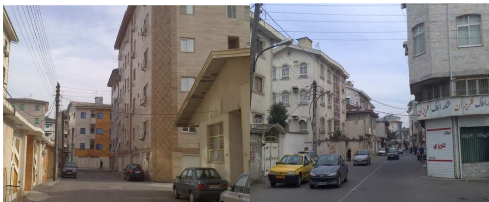
شکل ۶. خیابان اصلی بافت شمالی به سمت معلم شکل ۷. کوچه‌های بافت شمالی محله استادسرای رشت