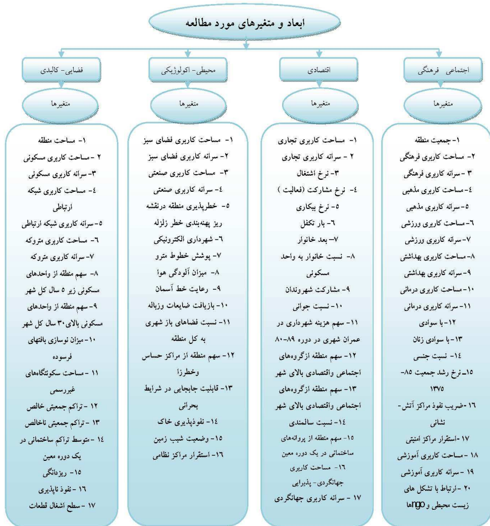
شکل ۱: دسته بندی متغیرهای پایداری همگن، (منبع: نویسندگان، ۱۳۹۳).