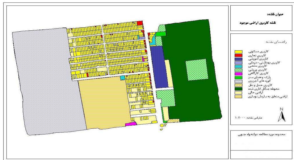
شکل ۲: نقشه کاربری اراضی محدوده دولتخواه جنوبی

برای بررسی میزان مشارکت و عوامل تاثیرگذار بر آن، به پرسشگری از مردم محلی پرداخته شد. در این راستا با در نظر داشتن متغیرهای اقتصادی، اجتماعی، روانشناختی، محتوای پروژه، سن و تحصیلات به بررسی رابطه بین این متغیرها و میزان مشارکت مردم در ساماندهی بافت‌های فرسوده محلی اقدام شد.