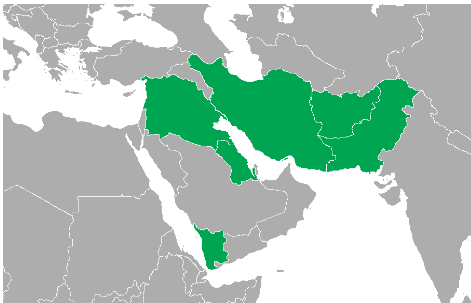
شکل ۲. کشورهای حوزه‌ی محور مقاومت

محور مقاومت: محور مقاومت را می توان یک همگرایی ژئوپلیتیکی در نظر گرفت که از نظر فلسفه و معرفت‌شناسی یا رخداد انقلاب اسلامی در ایران آغاز شد و به یک رویه و واقعیت سیاسی و مکانی در غرب و جنوب غرب آسیا تبدیل گردید (Dyer, 2017: 4). گزاره‌های انقلاب اسلامی با محوریت اسلام سیاسی به آسیای میانه و قفقاز هم سرایت کرد (Bishku, 2015: 86). بر پایه‌ی ماهیت متفاوت انقلاب اسلامی ایران که به نوعی گفتمان جدیدی را در مقابل کمونیسم و کاپیتالیسم ارائه می‌داد، لزوم بیداری و هویت‌یابی مجدد مسلمانان بر اساس فرهنگ و تمدن اسلامی مورد تاکید قرار گرفت (متقی و قره‌بیگی، ۱۳۹۳: ۶۶). این فرایند با افزایش تحولات در جهان عرب که از سال ۲۰۱۱ به این سو آغاز شد، روندی تازه به خود گرفت و کشورها و گروه‌هایی که با آرمان‌های انقلاب اسلامی در ایران، همخوان و همگرا بودند، محور مشترکی را برای مقابله با قلمروخواهی کشورهایمانند آمریکا، اسرائیل و عربستان سعودی تشکیل دادند (Yagnar, 2016: 298). محور مقاومت، مجموعه‌ای از واحدهای سیاسی-فضایی و گروه‌های نیابتی است (صادقی و همکاران، ۱۴۰۰: ۹۲). کشورهایی چون ایران، سوریه، فلسطین و عراق به عنوان کشورهای حوزه‌ی مقاومت و حزب‌الله لبنان، حشدالشعبی عراق، فاطمیون افغانستان، زینبیون پاکستان، حسینون آذربایجان و انصارالله یمن به‌عنوان کنشگران اصلی محور مقاومت به‌شمار می‌روند (شکل ۲).