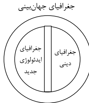
شکل شماره (۲) - رابطه جغرافیای دینی با جغرافیای جهان‌بینی

با توجه به مطالب قبلی می‌توان گفت که رابطه جغرافیای دینی با جغرافیای جهان‌بینی رابطه عام و خاص و به قول منطقیون رابطه عموم و خصوص من وجه است.