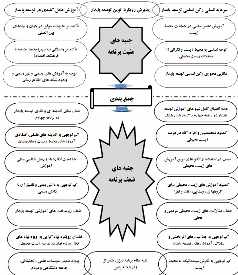
شکل ۳: جنبه‌های مثبت و منفی برنامه چهارم توسعه ایران بر اساس اهداف دهه ملل (ESD)

بنابراین، نگاهی گذرا به یافته‌های تحقیق، نشان داد که در محتویات برنامه چهارم حداقل از بعد اندیشه‌ای، سیاست‌گذاری و قانونگذاری گام‌های آرام برای گذار از توسعه کلاسیک به توسعه پایدار شروع شده است. بطوری که تلاش کرده است گزینه‌های قابل انتخاب برای مردم را در مورد توسعه پایدار و محیط زیست افزایش دهد و با زمینه سازی برای مشارکت و توجه به بخش خصوصی و مدنی در این محورها، برنامه را به برنامه الگوی یادگیری نزدیک سازد و مردم را از گیرنده و دهنده صرف اطلاعات به مشارکت در فرآیند مدیریت و برنامه ریزی فرا خواند. در جهت گیری‌های کلان و هم در حوزه‌های بخشی برنامه ریزی برنامه چهارم نیز این حرکت قابل تامل و مشاهده است و اینها نشان از همراهی ج.ا.ا با چالش اساسی جهان در زمینه توسعه پایدار و محیط زیست دارد. اما تا رسیدن به اهداف دهه ESD و تحقق ارزش‌ها و اصول بنیادین توسعه پایدار گام‌ها فاصله وجود دارد.