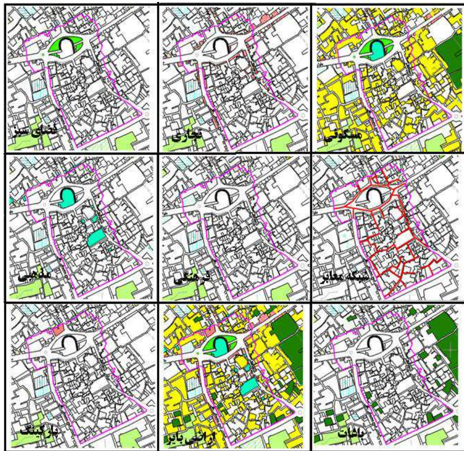
شکل ۱: کاربری اراضی وضع موجود محدوده بافت فرسوده شهر بافق

۱۳۸۳:۱۸۰) محدوده بافت فرسوده شهر بافق از نظر شبکه گازرسانی و سیستم محل دفع زباله از وضعیت مناسبی برخوردار نیست به ویژه که جمع‌آوری زباله توسط شهرداری به نحو مطلوب صورت نمی‌گیرد و آلودگی زیست محیطی به شدت در محدوده بافت دیده می‌شود که لازم است مسئولین توجه جدی به این امر داشته باشند. ۲۲۱۴ مترمربع از کاربری‌های شهری بافت فرسوده به کاربری پارکینگ اختصاص دارد که سرانه آن ۱/۴ مترمربع است. این کاربری‌ها سطحی معادل ۱/۱ درصد از مساحت کاربری‌های موجود در محدوده مورد مطالعه را می‌پوشاند و به لحاظ قرارگیری در کناره خیابان اصلی جزء محدوده بافت فرسوده محسوب شده است.