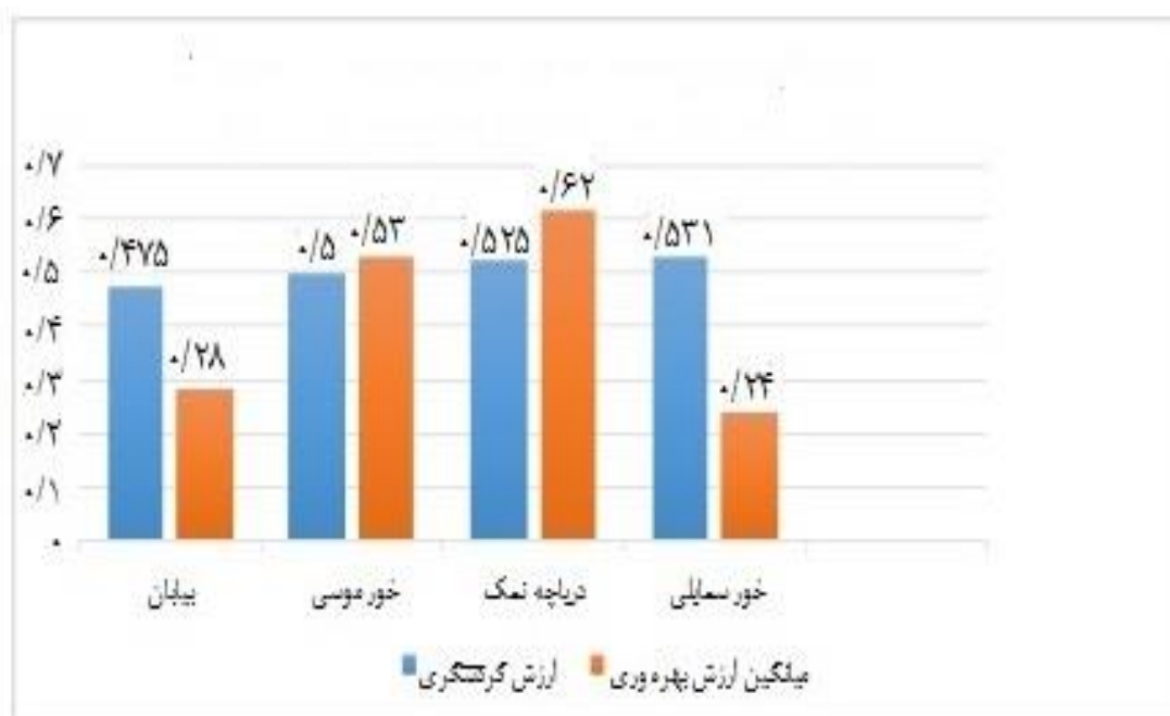
شکل ۳. نمودار میانگین ارزش گردشگری و ارزش بهره‌وری شهرستان ماهشهر