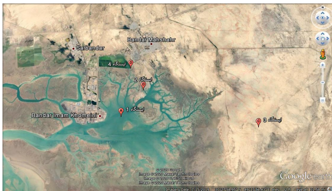
شکل ۱. نقشه موقعیت ۴ ایستگاه مورد مطالعه در منطقه مورد مطالعه.