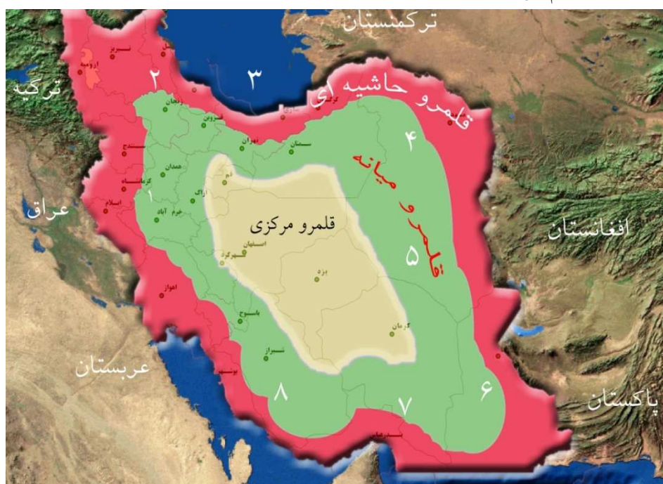
شکل ۱: نقشه راهبردی - دفاعی سرزمینی ایران - منبع: ۷

اعلام خبر به موقع حمله هوایی یکی از اصول پدافند غیرعامل است که نقش مهمی را در تقلیل و کاهش صدمات و خسارات تأسیساتی، تجهیزاتی و نیروی انسانی یک مجموعه و یا سازمان درون شهری انجام می‌دهد.